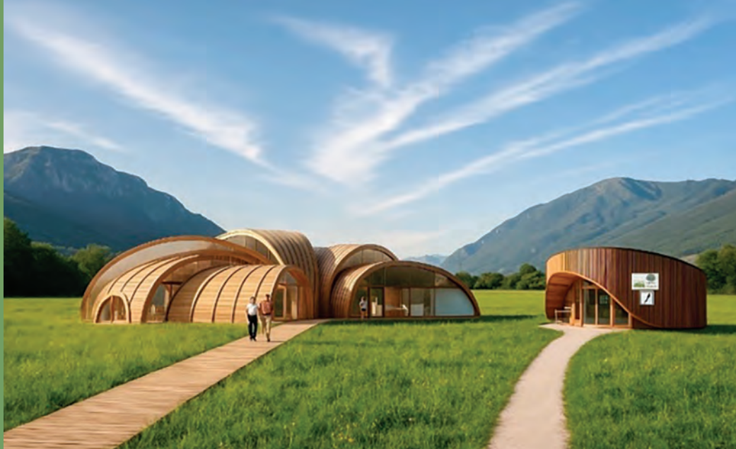
Rendering: il centro di informazione turistica digitale di Pian Camuno

Riconosciuti crediti formativi professionali (CFP) per architetti, ingegneri, geologi, geometri e dottori forestali